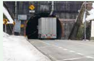
城山トンネル入り口