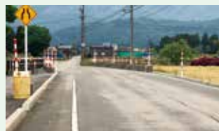
県道黒部朝日公園線・野中地内