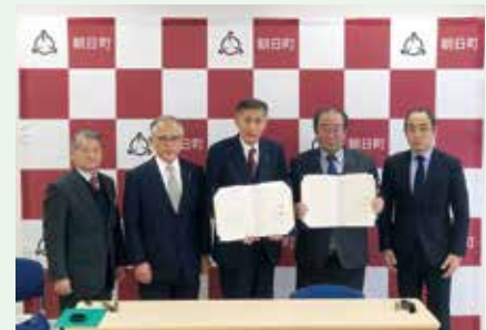
富山大学医学部の朝日町寄附講座の更新（R4.3.13）