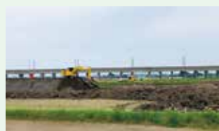
ほ場整備が進む高橋地区