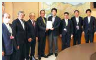
国交省北陸地方整備局 国道8号要望（R4.5.16）