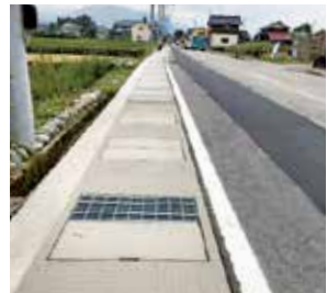
側溝に蓋がされた整備後の姿(横道地内)