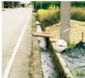
上今江地内の側溝