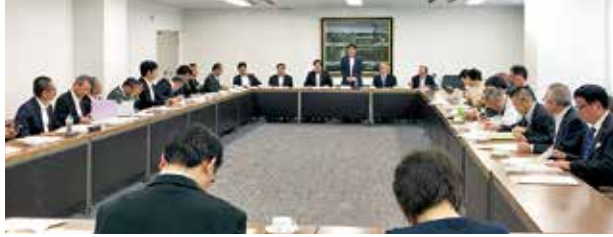
友好団体との意見交換