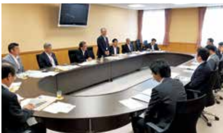
小俣局長（当時）他幹部の皆様