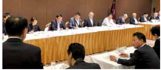
市町村支部との意見交換