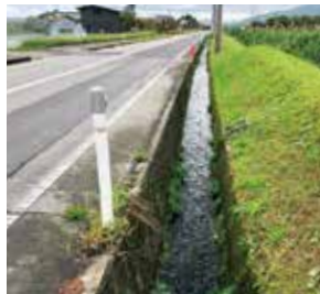
不動堂～横水間の側溝