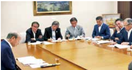
石井知事との真剣なやりとり